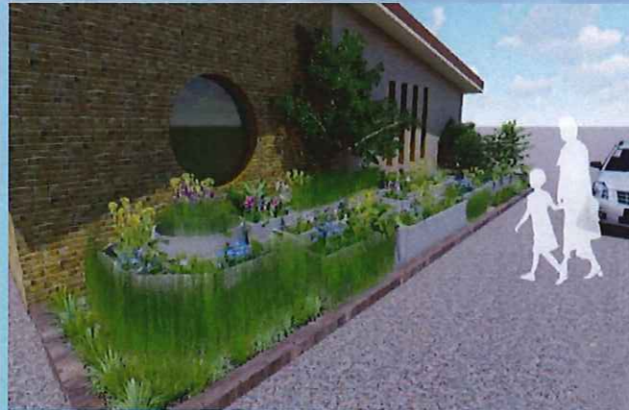
夏に花が咲いた雨庭のイメージ図 四季折々の花が楽しめるようになっています