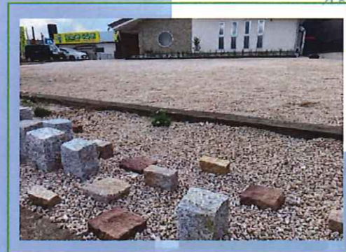
ピンコロ石でビル群をイメージ