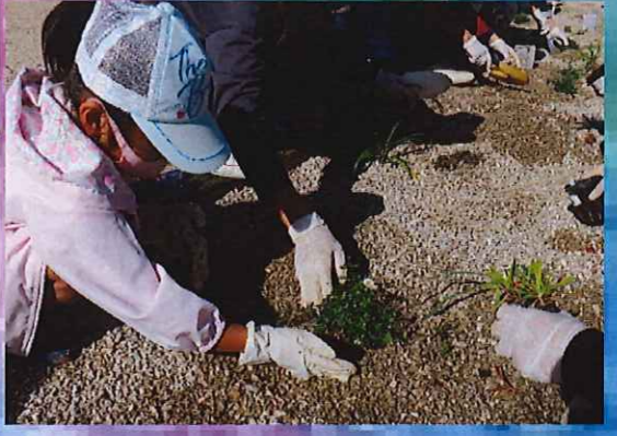
地域の方々と一緒にどのようなあめにわを作るか 意見を伺い、一緒に植樹しました